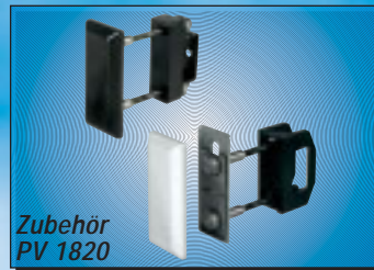
Zubehör PV 1820

Die richtige Befestigung eines Panzer-Riegelschlusses ist von elementarer Bedeutung für den Sicherheitswert. Hier bieten ABUS-Produkte entscheidende Vorteile. An beiden Seiten der Tür erfolgt eine sichere Verbindung der Schließkästen mit dem Mauerwerk, um so ebenfalls hohe Hebelkräfte aufzunehmen.