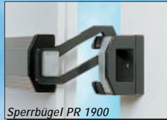
Sperrbügel PR 1900

Das ABUS Modell PR 1900 ist mit einem Sperrbügel ausgestattet. Ein solcher Sperrbügel ermöglicht es Ihnen, die Tür spaltbreit zu öffnen, um so bei gesicherter Tür mit außen stehenden Personen zu reden. Diese Option schützt ganz besonders im Haus befindliche Personen. Speziell bei Kindern sollten Sie in keinem Fall auf den Sperrbügel verzichten.